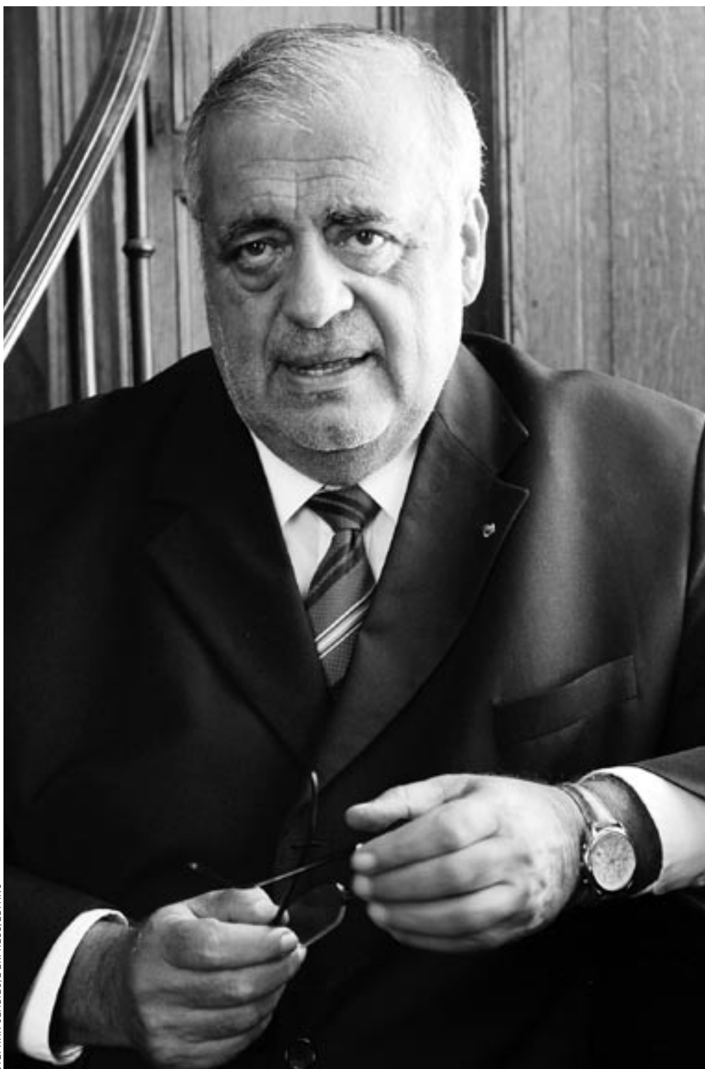
Philippe Séguin: « J'ai toujours su que j'étais de passage dans les meubles de la République. »

Philippe Séguin promet qu'il a tourné la page. Un choix difficile. La politique est bien