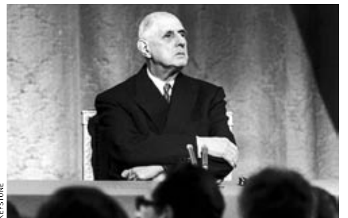
C'est sa « référence suprême ». Philippe Séguin admire « le visionnaire, l'homme d'action et l'écrivain ». Comme le général, il est passionné par Chateaubriand. C'est Charles de Gaulle qui a déterminé son engagement politique.